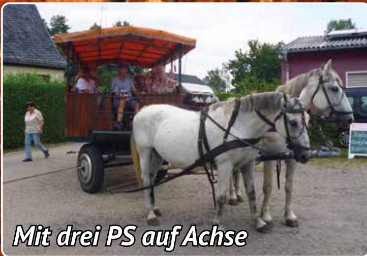
Mit drei PS auf Achse