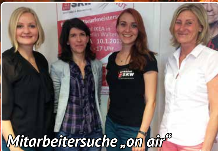
Mitarbeitersuche „on air“