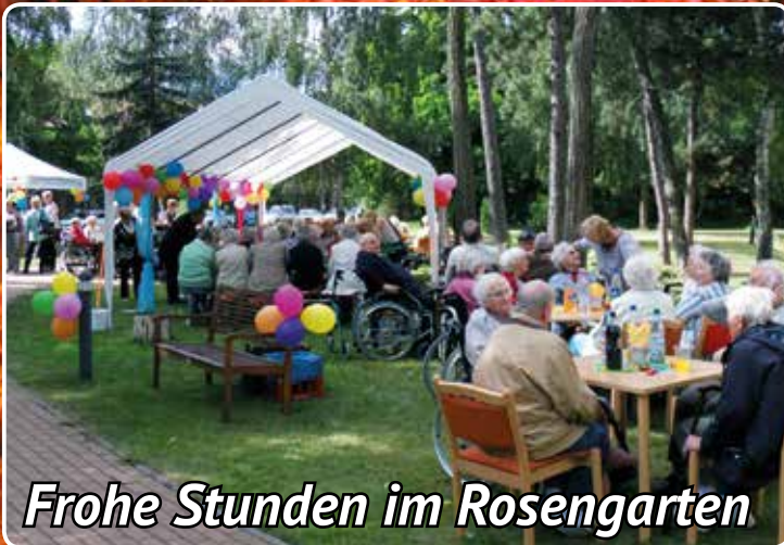
Frohe Stunden im Rosengarten